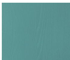
P.40 - Mare