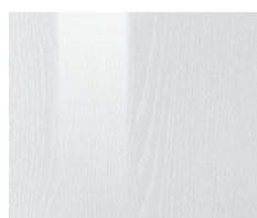
PL.10 - Bianco Lucido