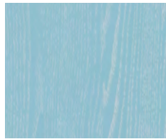
Decapé Azzurro Venatura Bianca