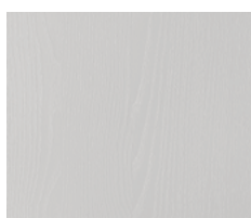
P.11 - Bianco Riso