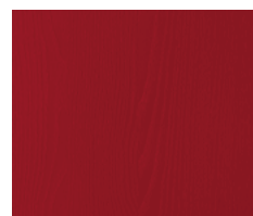
P.50 - Rosso