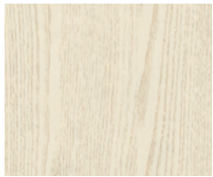
Decapé Avorio Venatura Beige